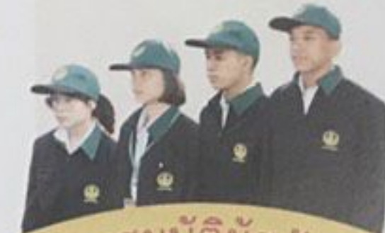
คุณสมบัติผู้สมัคร